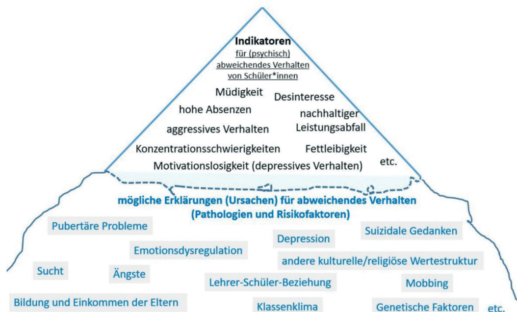
Abbildung 1: Eisberg-Modell (Heidenhofer 2020, S. 256)

Das Mehr-Ebenen-Modell (vgl. Heidenhofer 2020, S. 256) für die Aus- und Weiterbildung von Pädagog:innen stellt deshalb eine weitere Säule der Früherkennung bzw. Vernetzung zwischen Schüler:innen und Schulpsychotherapeut:in dar. Im Kern handelt es sich um den Versuch in drei Schritten den Wahrnehmungsprozess von Pädagog:innen für psychische Auffälligkeiten ihrer Schüler:innen zu schärfen. Dieser Prozess beginnt mit dem Eisberg-Modell (vgl. Abbildung 1), das verdeutlicht, dass pädagogische Auffälligkeiten wie nachhaltiger Leistungsabfall, aggressives Verhalten etc. von Schüler:innen vielfach nur Indikatoren für darunter liegende psychische Problemfelder sind. Die dritte Stufe umfasst eine umfassende Heuristik, die Lehrer:innen erleichtert, mögliche pathologische Dimensionen abweichenden Schüler:innen-Verhaltens zu identifizieren. Genau hier endet jedoch der pädagogische Auftrag – diese Schwelle markiert den Beginn der therapeutischen Arbeit, die nur von Psychotherapeut:innen sowie klinischen Psycholog:innen bzw. von Kinder- und Jugendpsychiater:innen durchgeführt werden kann.