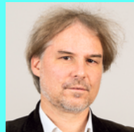
Martin Schenk Die Armutskonferenz

PRÄVENTIVE ANSÄTZE ZUR REDUKTION VON EXISTENZÄNGSTEN