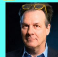
Golli Marboe VsUM