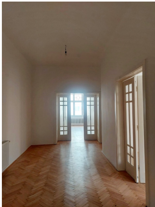
Warteraum mit 2 Toiletten