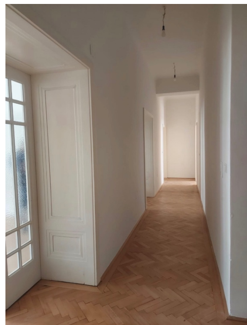
Gang zu den Therapiezimmern