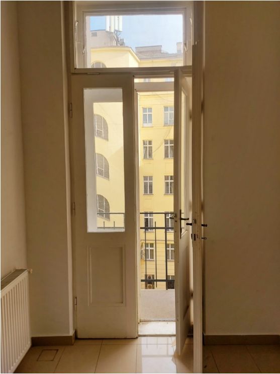
Esszimmer mit kleinem Balkon