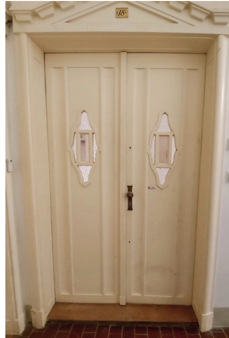
Haus mit Privatparteien, Arztpraxis und Anwaltskanzlei