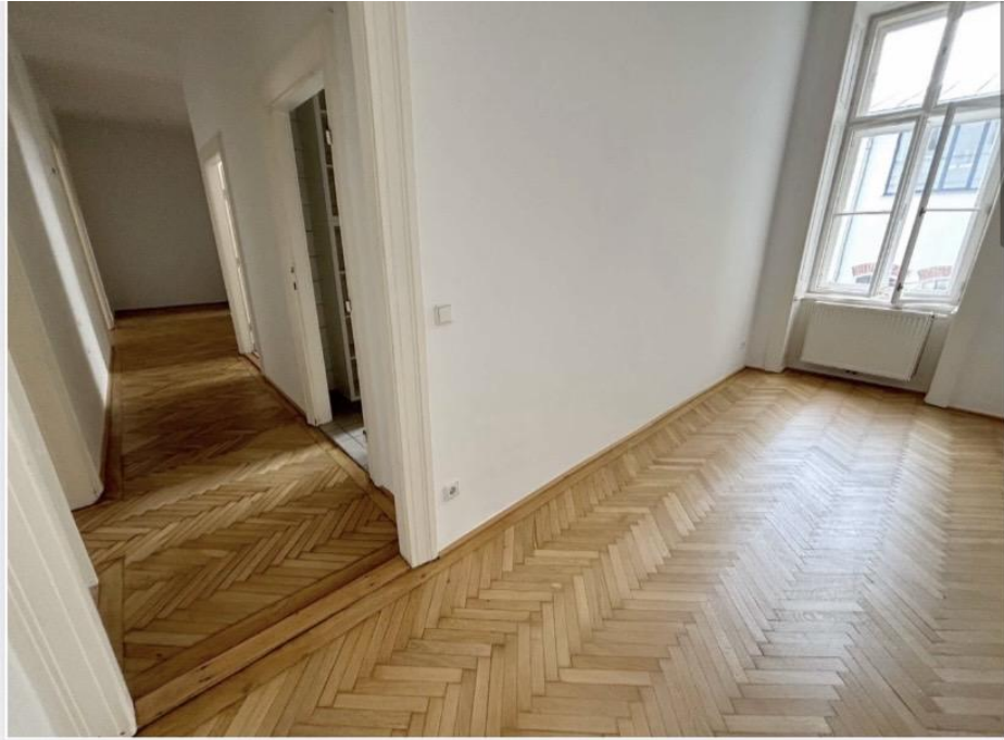
Kleiner Raum mit Blick in das Vorzimmer