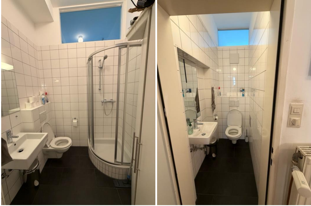
Bad/WC sowie extra WC