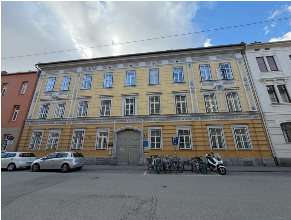
Haus Marschallgasse 15